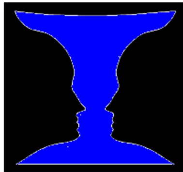
Jarrón de Rubín

De la Psicología GESTALT surge la ley de la dinámica de la figura y el fondo, que describe el flujo de la percepción. El ejemplo del conocido "Jarrón de Rubín" deja claro que nuestro organismo solo puede centrarse en un fenómeno a la vez.